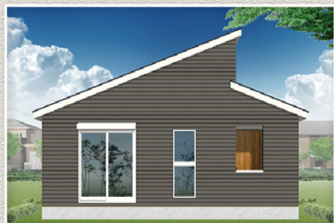
2号棟 完成予想イメージ