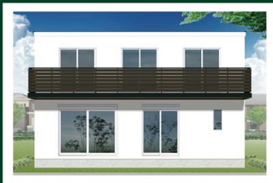
26-4号棟(南面) 完成予想イメージ

南面に広がるLDKに リビングイン階段をプラスした コミュニケーションを高める家。