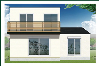
26-6号棟(南面) 完成予想イメージ

スタイリッシュなキッチン、 機能的なランドリールーム。 憧れの住空間をカタチにした家。