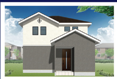
27-11号棟(北面) 完成予想イメージ