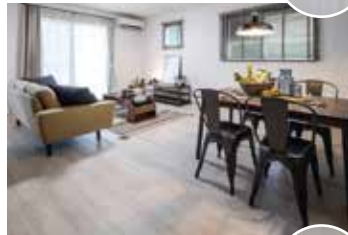
写真はフローリングの施工イメージです。