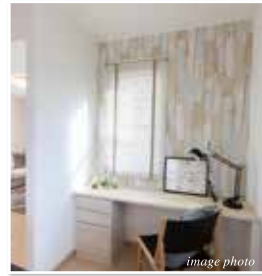
デスクファニチャー