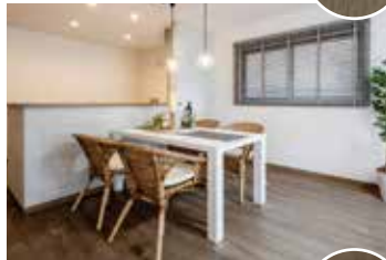
写真はフローリングの施工イメージです。