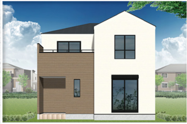
10号棟(南面) 完成予想イメージ