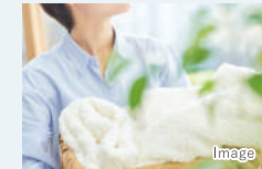
1 ランドリー ルーム

毎日のお洗濯を効率よく行えるカウンター付の空間。急な雨の時の一時保管場所、花粉や梅雨の時期の室内干しのスペースとしても大活躍です。